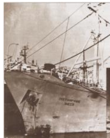
Рыболовный траулер «Пограничник Змеев»